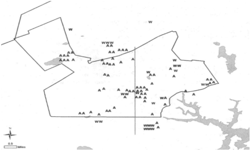
図3 セイラムタウン及びその周辺における告発者と魔女容疑者の分布